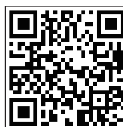
公式ホームページ (仮)